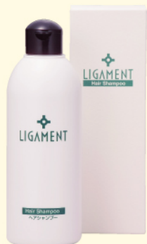
リガメント・ヘアシャンプー 300ml ¥2,730