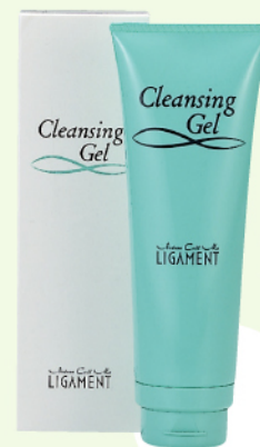
リガメント・クレンジングジェル 120g ¥3,675

水溶性ジェルタイプですから、肌に密着した皮脂汚れなどを乳化させながら落とします。