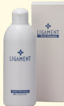
リガメント・ボディシャンプー 300ml ¥2,730