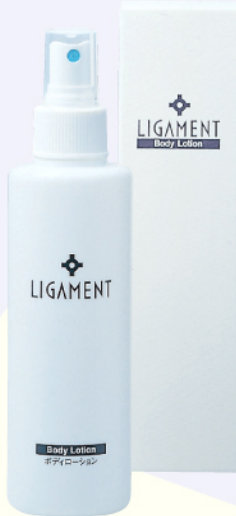
リガメント・ボディローション 200ml ¥2,730

ボディローションだけでも肌が「しっかりうるおった」と感じるくらいに使用すれば、その後のローションやモイスチュアジェルがぐんと効果的になります。