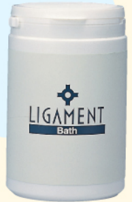
リガメント・バス 1kg ¥6,300