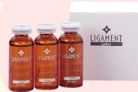
リガメント・ローション 30ml×3本 ¥7,140