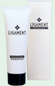
リガメント・モイスチュアジェル 120g ¥10,500