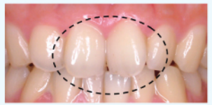
前歯にステインの沈着がなく、歯面の光沢が見られる