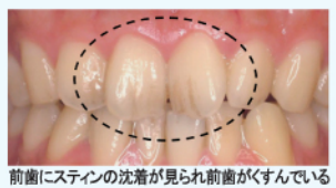
前歯にステインの沈着が見られ前歯がくすんでいる

歯周組織の修復に有効なポリリン酸。歯周病菌の増殖抑制効果があるポリリン酸。これらは同じポリリン酸でも、各々の効果が最もよく現れる長さ(ポリリン酸のサイズ)が存在します。柴博士は、これらに最も効果的なポリリン酸のサイズを特定するとともに、特定の長さのポリリン酸を精製する技術を開発しました。これが、特許成分「分割ポリリン酸」です。以前より歯磨き剤の有効成分(歯石の沈着防止効果のある成分)としても使用されているポリリン酸ですが、本商品に配合されているホワイトニング用分割ポリリン酸は、歯に付着したステインの除去・沈着防止に効果的な長さ(サイズ)のポリリン酸のみを精製・濃縮しました。この分割ポリリン酸は、従来のポリリン酸より数倍ホワイトニング効果が優れています。