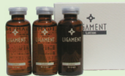
リガメント・ローション (高保湿糖分配合美容液) 30ml×3本 ¥7,140

●私たちの見ている肌の色は、真皮・表皮・角質層の3つの層が重なってできた色です。健康な肌は、真皮層の毛細血管に滞りなく血液が流れ、表皮に栄養や酸素が運ばれ、どんどん細胞分裂していきます。表皮内では肌細胞が角質細胞に向かって角化(新陳代謝)していきます。肌細胞が生まれて剥がれ落ちるまでの角化が健康であれば、メラニン色素も分解消化され、水分を十分保った肌密度の高い透明な肌が生まれます。