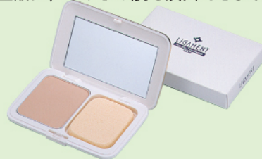
リガメント・パウダーファンデーション (紫外線散乱レフィル) 全3色 12g ¥4,200 ○パフ ¥168 ○ケース ¥1,260

リガメント・ローションで肌密度が増した肌をリガメント・パウダーファンデーションが透明感のある上質の肌演出します。スポンジにとるとふんわりしたパウダーが肌をすべるようになじみます。しばらくすると気持ちのいいくらい肌と一体化！その密着度は何も付けていないほど軽く、そして崩れにくいのです。さらにパフを濡らして、乾いたままのどちらでも使えるので、スポーティーでカジュアルに、エレガントで上品に、どちらの肌も演出できます。